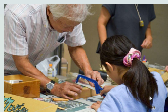
里山遊びワークショップ