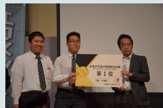
若者が主役の環境保全活動 アイデアコンテスト