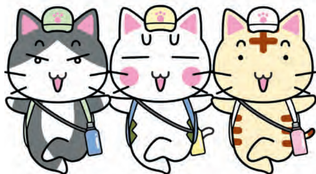
エコネコ©つやまあきひこ